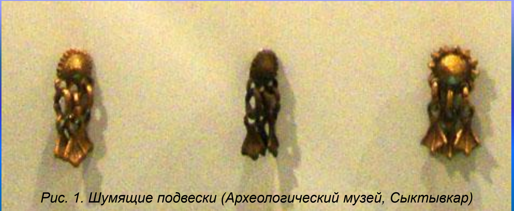
Рис. 1. Шумящие подвески (Археологический музей, Сыктывкар)

Костюмы также украшали пронизками и шумящими подвесками . Пронизки нанизывали на ремни или шерстяные шнурки. Подвески в виде коня символизировали счастье и благополучие в семье, а утки – связь с небесным миром.